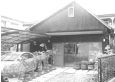
例：基礎コースで作れます

【住所】〒206-0001東京都多摩市和田12-3 【TEL&FAX】042-374-0746